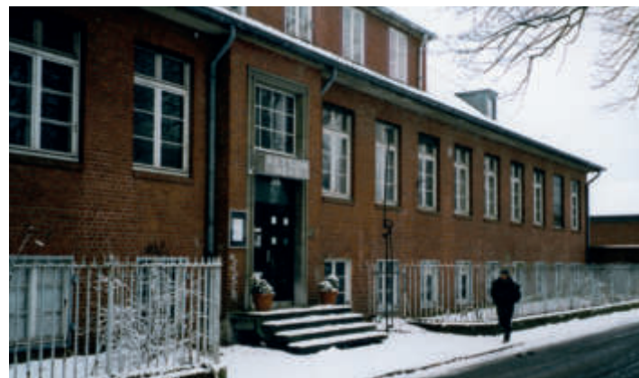
Das einstige Verwaltungsgebäude des Kettenwerks stand zwischen den beiden Einmündungen des Essener Bogens in die Essener Straße. Bis zum Abriss 1999 hatte der „Kunstverein Kettenwerk“ dort seinen Sitz.