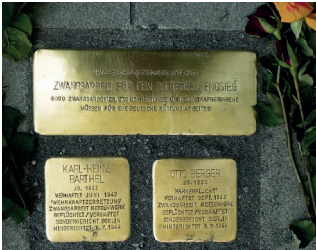
Seit Mai 2019 erinnern am Bürohaus Langenhorner Chaussee 623 drei Stolpersteine an die Kriegsproduktion am Ochsenzoll und an die Flucht der strafgefangenen Soldaten

Da wo sich heute am Essener Bogen das Gewerbegebiet erstreckt, standen im Zweiten Weltkrieg viele Produktionshallen des „Hanseatischen Kettenwerks“, wo für den Krieg Geschosshülsen aller Kaliber gefertigt wurden. An einem kalten dunklen Januarabend im Kriegsjahr 1944 durchstießen drei Männer – den höllischen Fabrikärm im Kettenwerk ausnutzend – mit Werkzeugen die Trennwand der stark gesicherten Werkhalle zu einer äußeren Abortanlage. Die Gelegenheit war günstig, denn für die 100 Werktätigen in den drei großen Werkhallen der „Beize“ war am 4. Januar 1944 nur ein Aufseher, der „Kommandoführer“ Kopp, eingeteilt. Die drei Männer huschten im Schutze der Dunkelheit über den Werkhof und überstiegen das Außengitter des Firmengeländes. Nur einer der drei, der 20-jährige Ernst Gravenhorst, hatte bei der