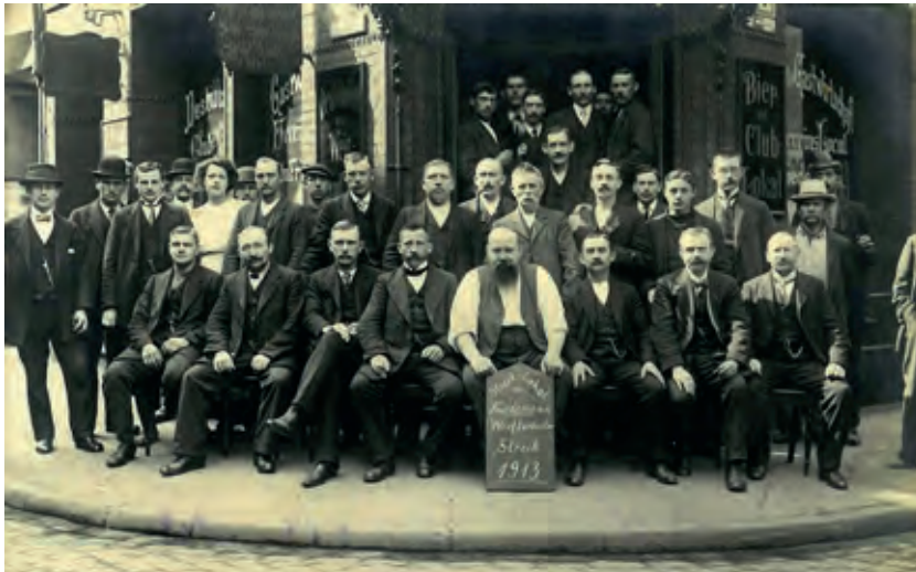
Streiklokal von Friedemann während des Werftarbeiterstreiks 1913, Ansichtskarte.