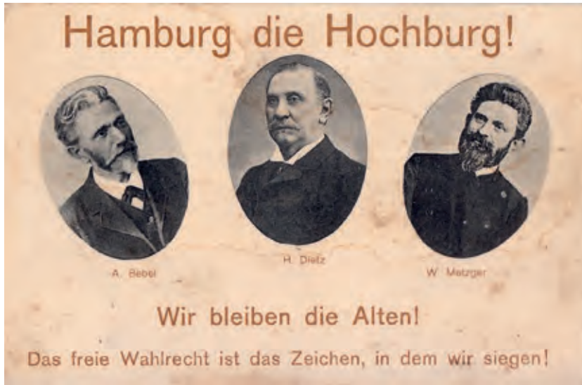
Die SPD-Reichstagsabgeordneten Bebel, Dietz und Metzger, gelaufen im August 1903.

gen, erstmals gingen alle drei Hamburger Reichstagsmandate an die SPD, was bis zur letzten Wahl im Kaiserreich im Januar 1912 (SPD: 61,3 %) auch so blieb. 13 Dabei wurden die drei Hamburger Reichstagsmandate jahrzehntelang von denselben SPD-Genossen wahrgenommen: