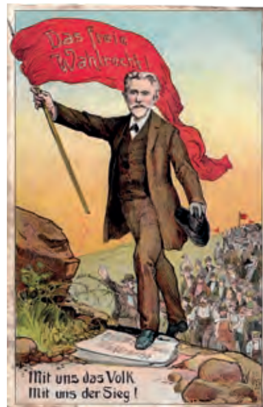
Mit uns das Volk Mit uns der Sieg!