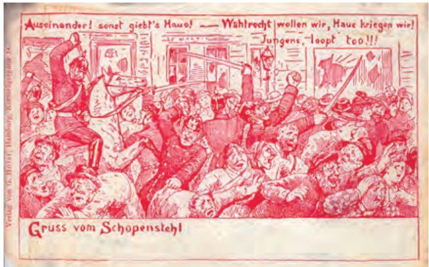
Ansichtskarte zum Wahlrechtsraub 1906, aus dem Verlag von G. Holst, Hamburg.

lesen. Die Empörung unter den fortschrittlichen und liberalen Kreisen war groß und kulminierte am 17. Januar 1906. Zehntausende Arbeiter verließen die Betriebe und folgten damit der SPD, die erstmals in Deutschland zu einem politischen Generalstreik aufgerufen hatte. Rund um den Fischmarkt und auf dem Schopenstehl kam es zu Straßenkämpfen und Plünderungen, die Polizei ging mit massiver Härte gegen Demonstrierende vor, Verletzte und zwei Tote waren die Folge. 19