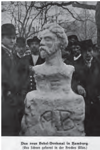
Das neue Bebel-Denkmal in Hamburg. (Aus Schnee geformt in der Brodes Allee.)

Links: Sympathisanten formen vis-à-vis zum Gewerkschafts-haus einen August Bebel aus Schnee, am Geburtstag Kaiser Wilhelms II., am 27. Januar 1910 (Hamburger Echo vom 28.1.1910).