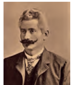
Carl Legien, aus dem Verlag Buchhandlung Vorwärts, Berlin, undatiert.

Neben den Gewerkschaften waren es die sich in den 1890er-Jahren entfaltende, hier allerdings etwas vernachlässigte Arbeitersport- und -kulturbewegung und die Sozialdemokratische Partei Deutschlands (bis Mitte Oktober 1890 Sozialistische Arbeiterpartei Deutschlands, SAP), die für den enormen