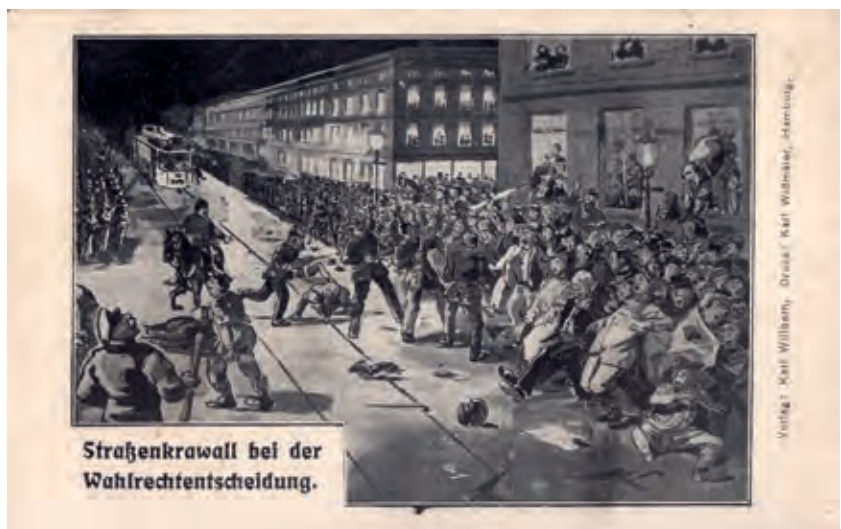
Ansichtskarte zum Wahlrechtsraub 1906, aus dem Verlag Karl Wülbern, Hamburg.

Auch wenn das Wahlrecht tatsächlich verschlechtert wurde, ging der »Rote Mittwoch« doch als richtungweisender Kampf der Arbeiter*innenbewegung für mehr Demokratie in die Geschichte ein. »Die Sozialdemokratie hat sich in dem Wahlrechtskampf«, so der Hamburger SPD-Funktionär